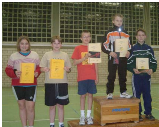
Vereinsmeister U13 - gemischt (siehe Text)