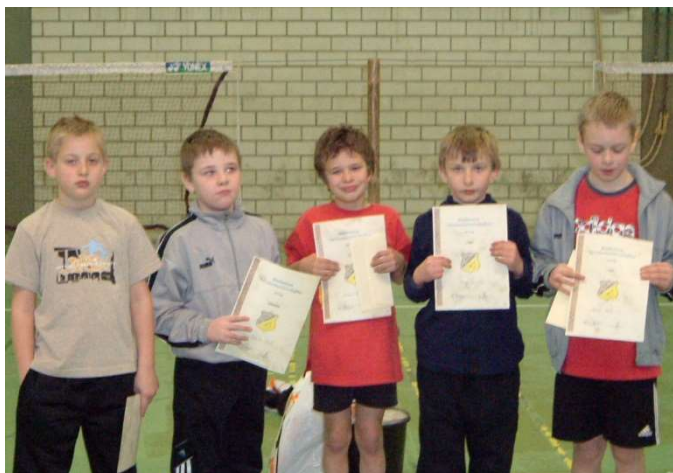
Unsere Sieger bei den Jungen unter 11 Jahren