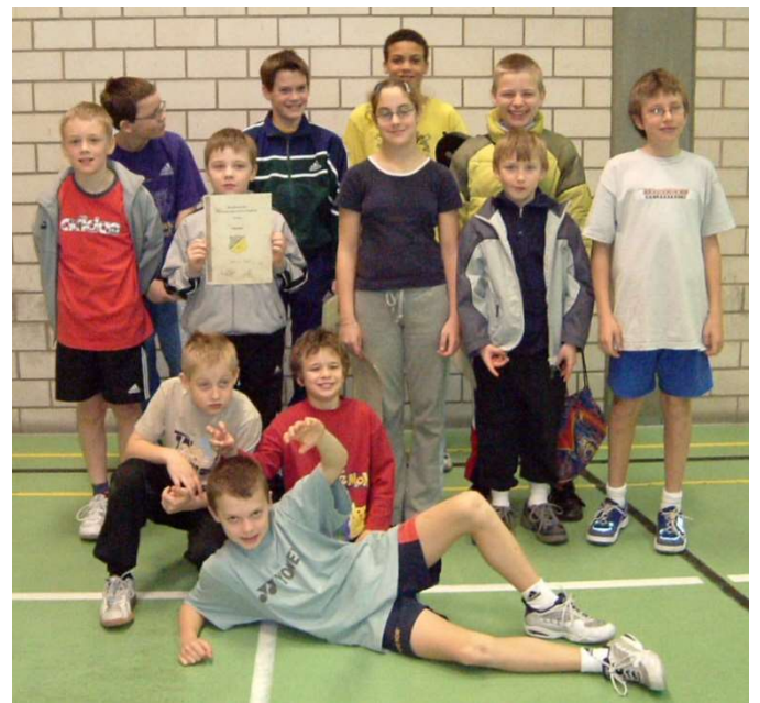
TuS Vereinsmeister – Badminton macht Spass