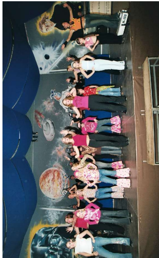
die Tanzgruppen des TuS Neu-Bamberg